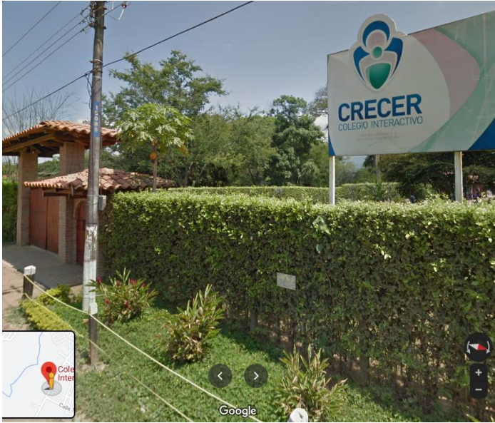
Tomado de Google Maps. https://goo.gl/maps/Kzsad3ZQoR4eZM2q6