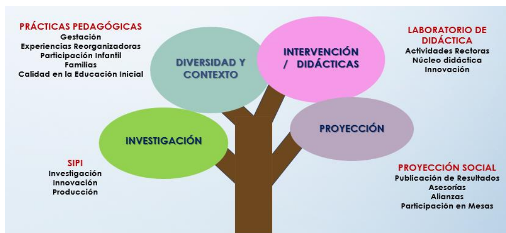
Ilustración 2 Centro de Estudios en Infancias UNIAJC